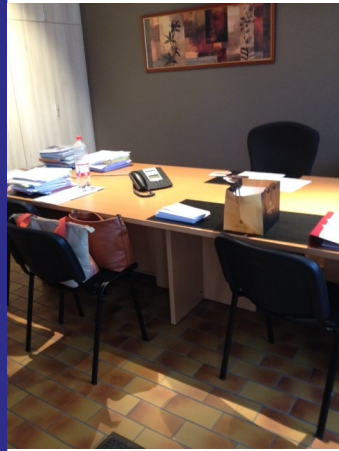
8u10: ... en dit wordt het dan! Mijn nieuwe bureau!