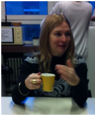
8u15: Toch even tijd nemen voor een kopje koffie in de leraarskamer.