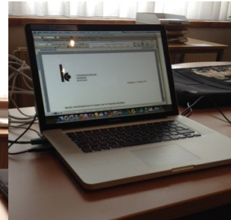
10u00: Tijd voor wat computerwerk: brieven schrijven, ...