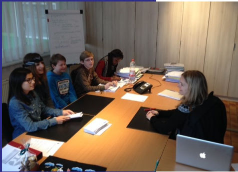
9u20: Tijd voor een diepteinterview met de reporters van 'De Uitkijk'.