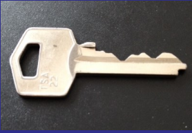
7u50: Ik ontvang de sleutel van mijn bureau.