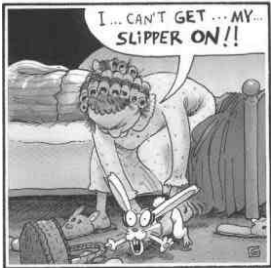
THE EASTER BUNNY GETS A RUDE AWAKENING.

Dan is het tijd voor een extra uur Frans. Ik volg twee extra uren Frans, naast twee uren Latijn. In Brussel heb je die taal toch meer nodig dan Latijn, hoewel ik dat heel graag doe.