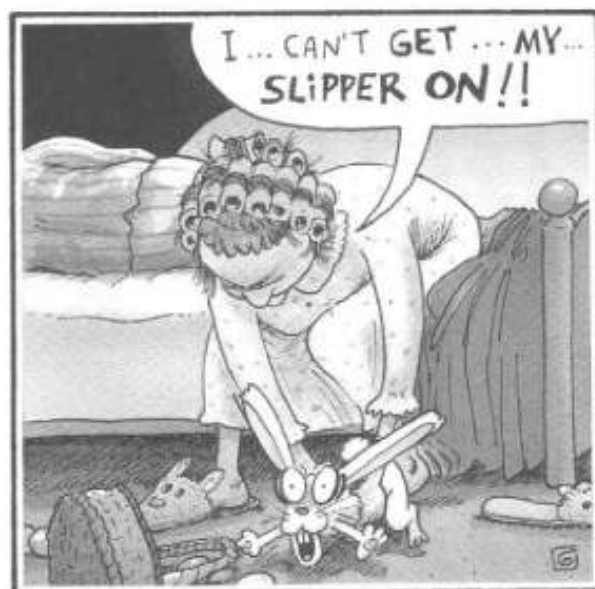
THE EASTER BUNNY GETS A RUDE AWAKENING.