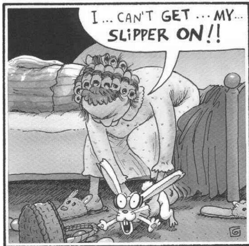
THE EASTER BUNNY GETS A RUDE AWAKENING.