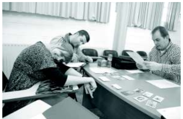
Workshops rond identiteit