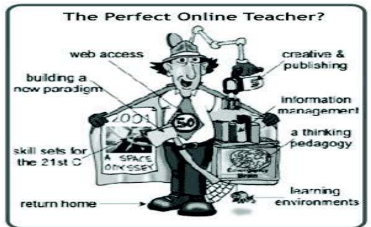
De eeuwige vraag... Worden wij allemaal computerleerkrachten? Wat brengt de volgende generatie?