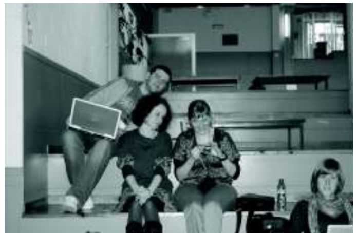
Werken aan ons project...