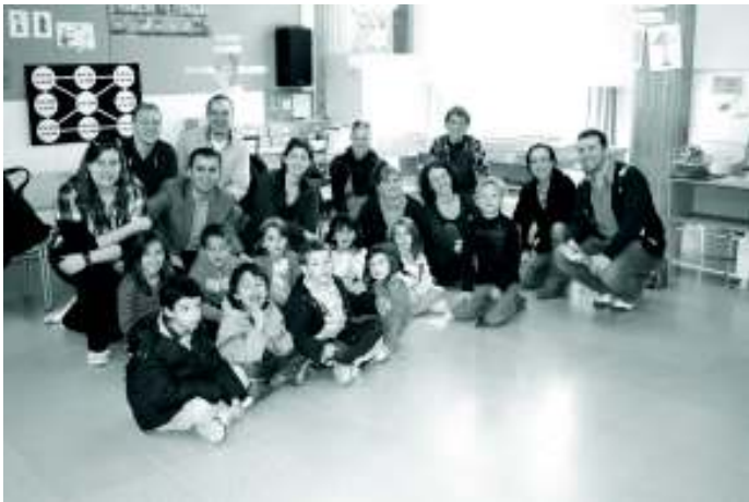
Op schoolbezoek in Sabadell

Het opstarten van ons eigen project “AN E-EYE-D CARD” waarover u de komende maanden meer zal horen, was ongetwijfeld de kers op de taart na een ongelofelijke week.