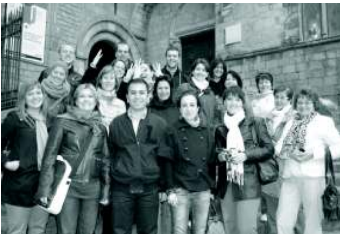
Op stadsbezoek in Barcelona.