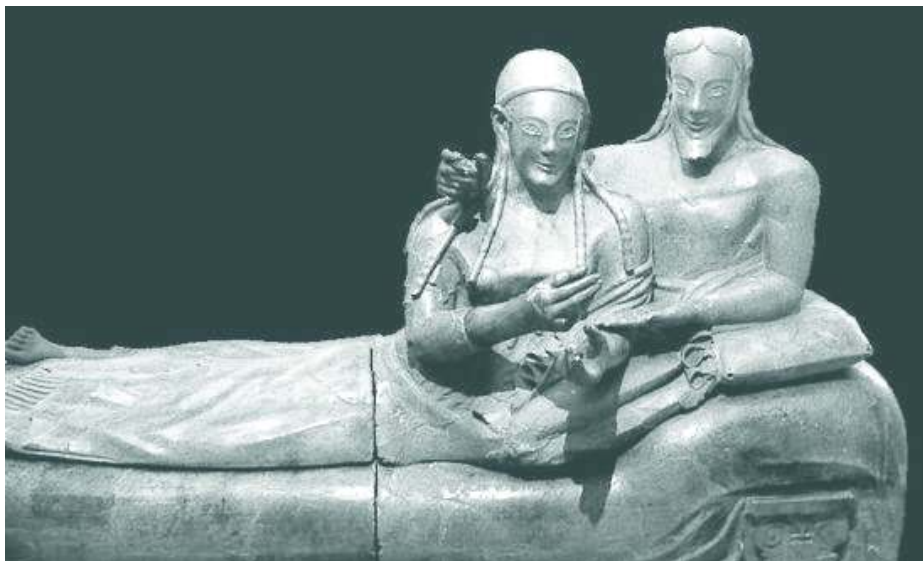
Liggend echtpaar, sarcofaag uit de necropool van Cerveteri