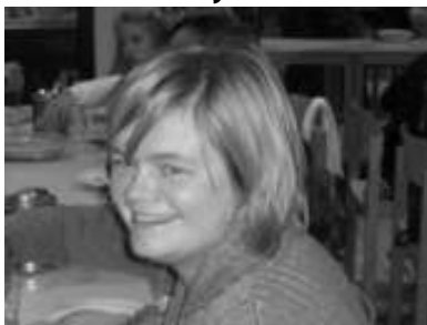
Een glimlach van de juf.

Hier komt hij dan: de quizvraag van de maand. Laat u blik glijden over de volgende woordenreeks: