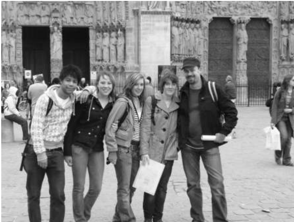
Parijs 2007-2008, wellicht het mooiste moment van de afgelopen zes jaar